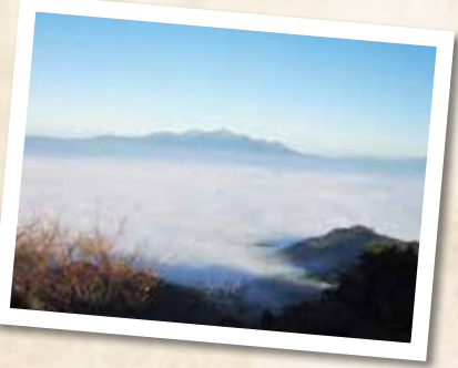
MAP F-4 金御岳公園 金御岳公園