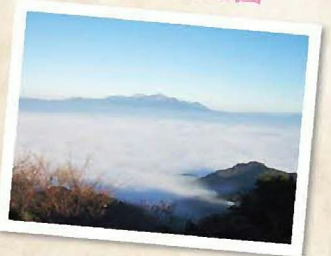
MAP F-1 金御岳公園